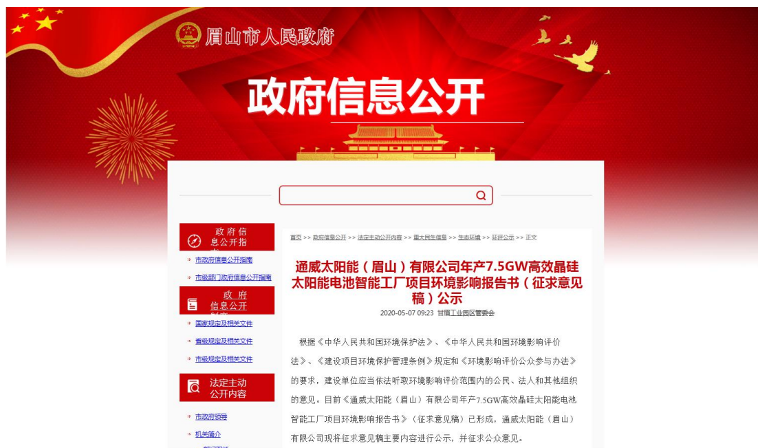
图 2 通威太阳能（眉山）有限公司年产 7.5GW 高效晶硅太阳能电池智能工厂项目征求意见稿网络公示截图