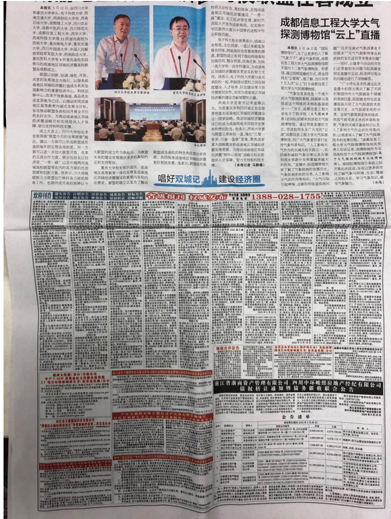
图4 2020年5月20日四川科技报公示截图