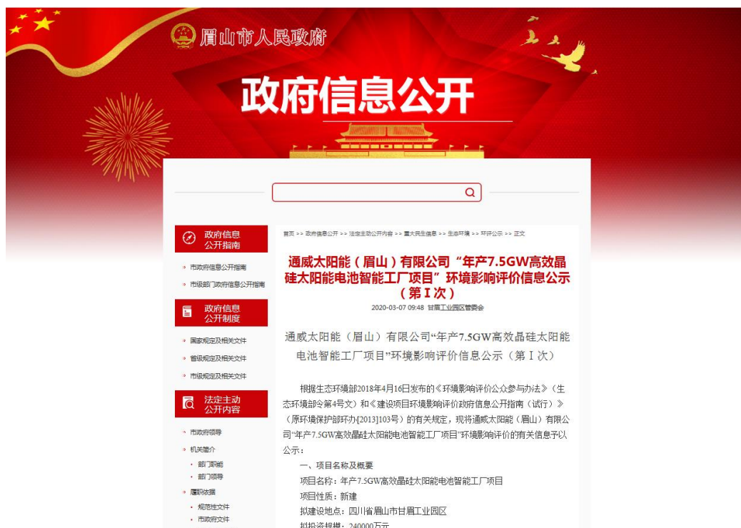
图 1 通威太阳能（眉山）有限公司年产 7.5GW 高效晶硅太阳能电池智能工厂项目第一次网络公示截图