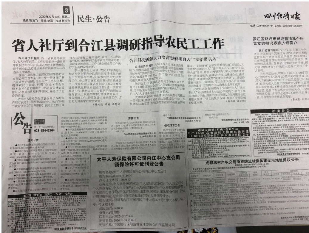
图3 2020年5月19日四川经济日报公示截图